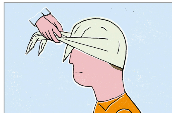
Anlegen eines Kopfverbandes