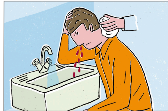
Versorgung bei Nasenbluten