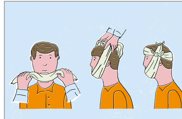
Anlegen eines Kinnverbandes