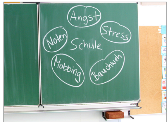
Schüler sind einer Vielzahl von Stresssituationen ausgesetzt.

Daneben kann eine Hyperventilation auch durch körperliche Erkrankungen wie Vergiftungen, Infektionskrankheiten, Entzündungen des Gehirns, Hirntumore, Schädel-Hirn-Traumata, Schlaganfälle und Elektrolytstörungen verursacht werden.