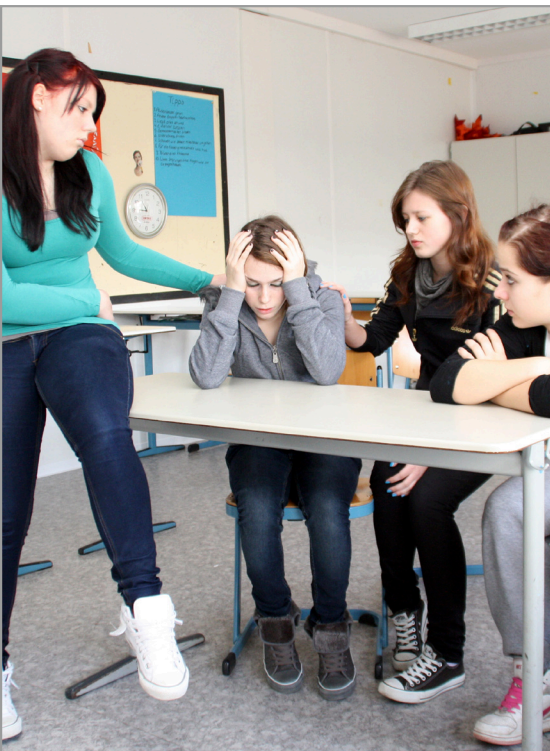
Oft sind psychische Ursachen, wie Ängste, der Grund für eine Hyperventilation. Gut, wenn man dann nicht alleine ist.

Die normale Atemfrequenz des Erwachsenen liegt bei 12-20 Atemzügen pro Minute. Ist die Atemfrequenz erhöht, so spricht man von einer „beschleunigten Atmung“ (Hyperventilation).